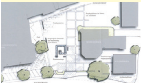
Ideen für eine Aufwertung rund um das neue Rathaus

Es ist nicht einfach, in das Landessanierungsprogramm aufgenommen zu werden. Dank Ihrer aktiven Unterstützung im Rahmen der Bürgerbeteiligung und der daraus resultierenden guten Vorarbeit ist es uns in diesem Jahr dennoch auf Anhieb gelungen. Wichtig war dabei, dass wir dank dieser erfolgreichen Zusammenarbeit bereits einen Gemeindeentwicklungsplan, die ZON2025 vorweisen konnten. Die Fördersumme von 900.000 Euro gibt uns einen ordentlichen Handlungsspielraum, den wir nun für die Neugestaltung der Ortsmitte nutzen können. Nachfolgend finden Sie in chronologischer Reihe nochmals die bisherigen Projektschritte.