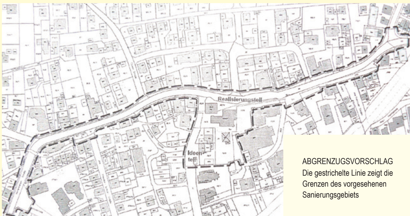
ABGRENZUGSVORSCHLAG Die gestrichelte Linie zeigt die Grenzen des vorgesehenen Sanierungsgebiets