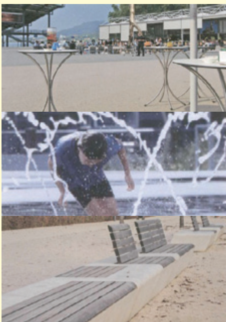
Beispiele für eine Aufwertung der Ortsmitte