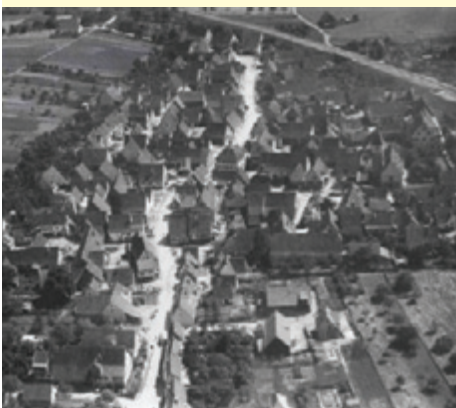
Nufringen 1929