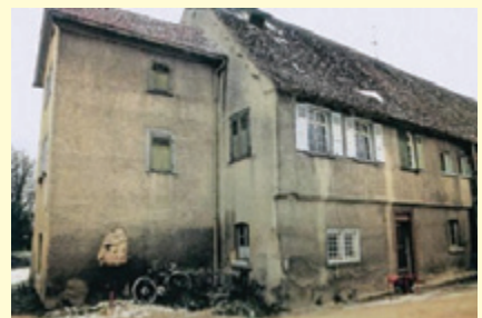
Beispiel einer gelungenen Gebäudesanierung